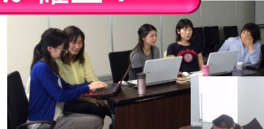
スキルアップ講座