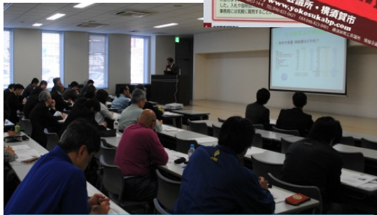
米海軍・海上自衛隊入札説明会

米海軍基地内で発注される建設工事・物品調達等の入札・受注促進を目的としたビジネスマッチング事業。入札サポート、翻訳、入札説明会等の実施により、地域企業をサポート。 登録企業63社 落札件数 121件