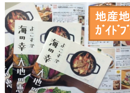
地産地消 ガイドブック

地産地消ガイドブック発行(10万部) 、“食”の展示会、大収穫祭、ゴールデン・ボンバー・コンサートへの出店等、地域産品のマッチングとPRを促進。